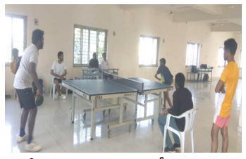
టేబుల్ టెన్నిస్ ఆడుతున్న క్రీడాకారులు